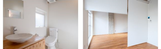
3・4階 可変性のある賃貸住宅

無垢材フローリングや打ちっ放しコンクリート壁が斬新。 リノベーション物件の楽しみがここに。 ロールスクリーンや可動間仕切りで可変性のある間取りを実現しました。